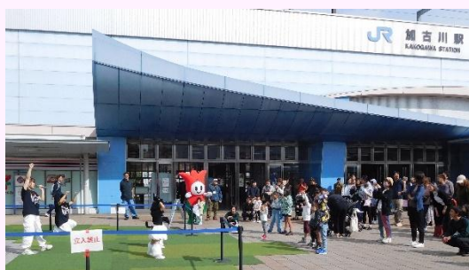
加古川駅前ダンスイベント (令和 7 年 11 月)