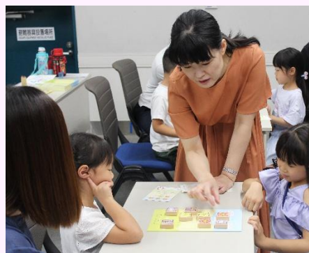
幼児向け将棋教室 (令和 6 年 8 月)