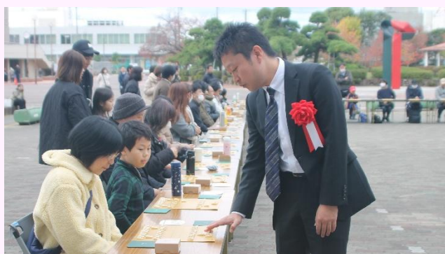
屋外での将棋イベント