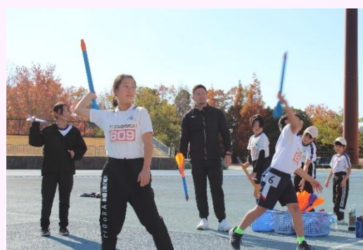
「トップアスリートに学ぼう！陸上競技教室」の様子 (令和7年11月)