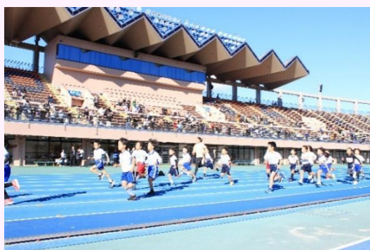
加古川韋駄天決定戦の様子(令和7年11月)