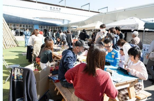
かこがわボードゲームマーケット （令和7年11月）