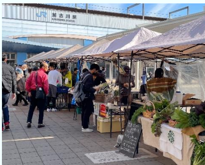
加古川ファーマーズマーケット×農林漁業祭（令和7年11月）