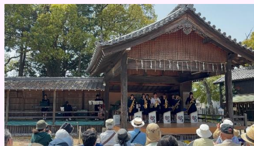
名所コンサート (令和 7 年 4 月)